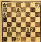
Мат в 3 хода. 1. Се!f