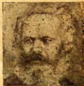
Карл Маркс (1818—1883)

Отмечаю годовщину смерти Карла Маркса, мы должны обратить самое серьезное внимание на укрепление своих теоретических позиций, всемерно повышая свою квалификацию и борясь за чистоту марксистско-ленинской идеологии против всякого рода правого и „левого“ оппортунизма. Надо всесторонне изучить и основательно усвоить богатое наследство, оставшееся нам от Карла Маркса. Нужно постоянно помнить слова, сказанные в свое время В. И. Лениным: „Роль передового борца может выполнить только партия, руководящая передовой теорией“.