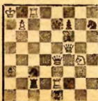
Мат в 3 хода. 1. Кh6.