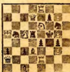
Мат в 2 хода. 1. К:е4f