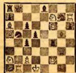
Мат в 3 хода. 1. Лh8.